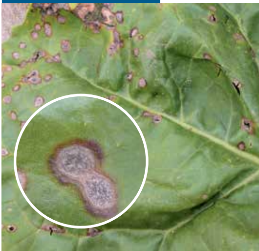
لکه برگی (سرکوسپورا)