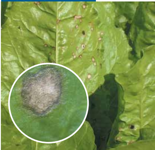
لکه برگی (رامولاریا)

مناطق قهوه ای بزرگ سبب میشود که برگ ها شبیه تنباکوی خشک دیده شوند. این بیماری نباید با بیماری لکه برگی رامولاریا اشتباه شود.