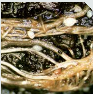
وجود سیست های سفید و کوچک بر روی ریشه