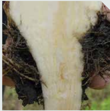
تکثیر ریشه های فرعی، تغییر رنگ آوند ها به قهوه ای و از بین رفتن آنها