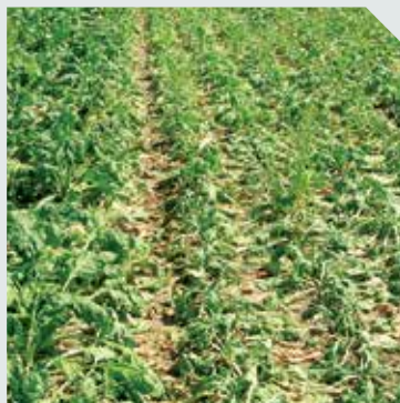
قطع ارتباط اندام هوایی گیاه با ریشه