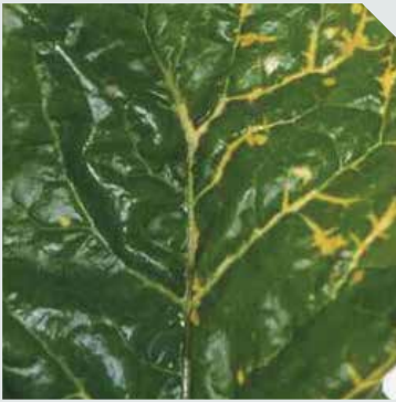
زرد شدن و رنگ پریدگی رگبرگ ها